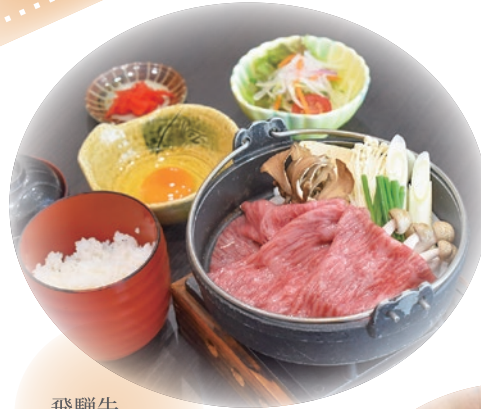
飛騨牛 すき焼き定食