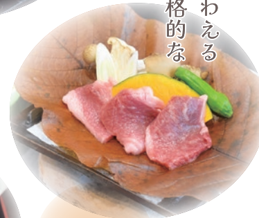
飛騨牛 朴葉味噌焼き定食