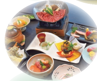
おまかせプラン お料理